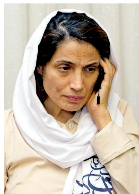
Nasrin Sotoudeh ha 55 anni

All'attivista per i diritti umani sono stati inflitti altri 33 anni di carcere e 148 frustate